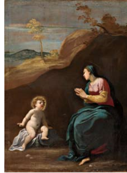
Carlo Bononi, Beata Vergine della Ghiara primo quarto XVII sec. olio su tela, 85 x 63 cm

L'opera ornava originariamente l'altare dell'Oratorio degli Infermi dell'ospedale ed è tuttora di proprietà dell'Arcispedale Santa Maria Nuova. È stato depositato presso i Musei Civici nel 1977.