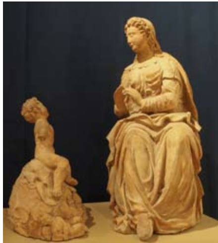
Scuola emiliana, Madonna col Bambino fine XVII - inizio XVIII sec. terracotta, 88 x 44 x 40 cm

Acquistata sul mercato antiquario nel 1986 dalla Direzione dei Musei Civici di Reggio Emilia, non è nota la provenienza esatta anche se la trattativa del tempo ricorda ben tre opere del Bononi conservate in chiese ferraresi. Le sue dimensioni ridotte fanno pensare ad un oggetto di devozione privata.